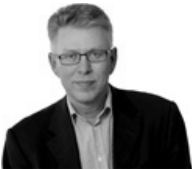
Профессор Нилс Карлсон – генеральный директор института политологии и экономики в Стокгольме (The Ratio Institute)

Изучая шведский опыт, Нилс Карлсон пришел к выводу, что негативные последствия обобществления невозможно измерить лишь экономическими показателями – собесовское государство неизбежно деформирует характер человека и его мораль. Для