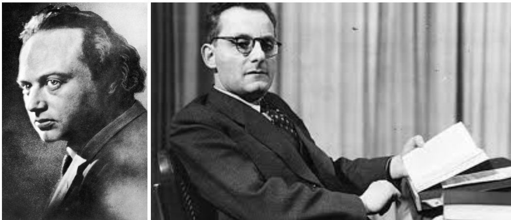
Пражские друзья Кафки, писатели Франц Верфель (слева) и Макс Брод

Как бы ни оценивать вовлеченность Франца Кафки в еврейскую жизнь или, напротив, отстраненность от этой жизни, нельзя не заметить присущего ему ощущения глубинной, едва ли не ветхозаветной, принадлежности к еврейскому народу. В одном из писем к переводчице Милене Есенской, в которую писатель был влюблен, содержится выразительное признание: «... у меня за плечами путешествие в 38 лет, да еще длиннее – ведь я еврей...»